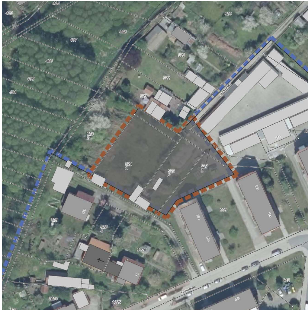
Ausschnitt 5. Änderung KES Kernstadt Beeskow – Ergänzungsfläche 5a auf Liegenschaftskarte & Luftbild