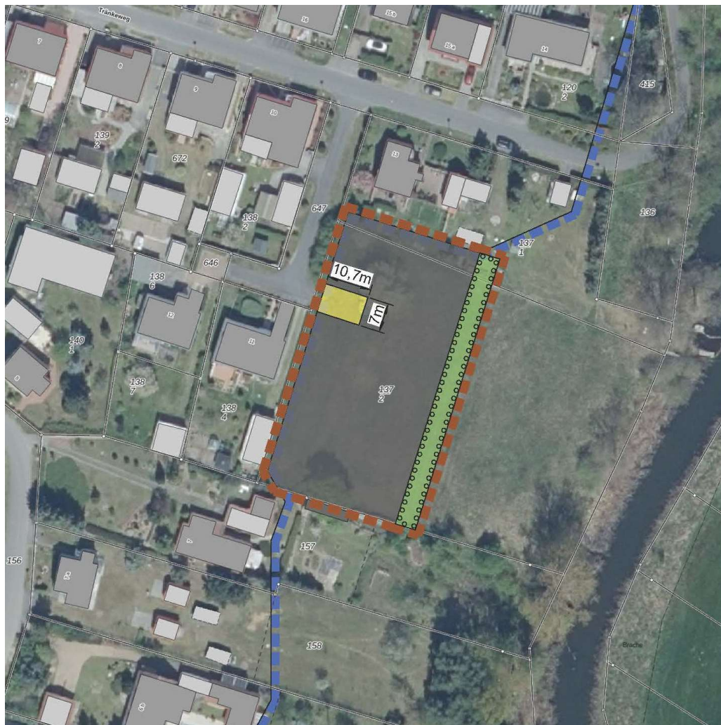
Ausschnitt 5. Änderung KES Kernstadt Beeskow – Ergänzungsfläche 5c auf Liegenschaftskarte & Luftbild